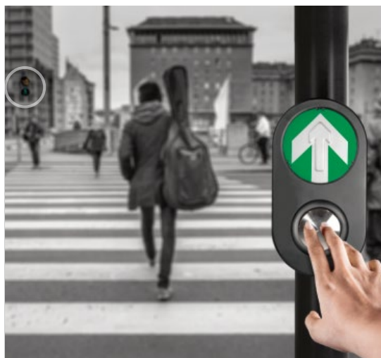
EJEMPLO DE USO

Incluye espárragos, rondanas y tuercas para fijación a poste.